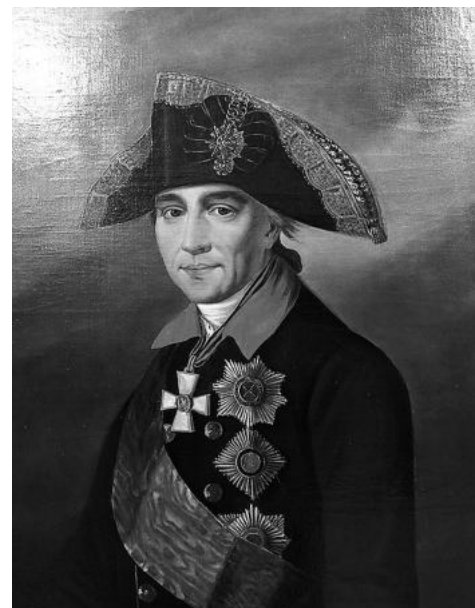
Граф Михаил Федотович Каменский