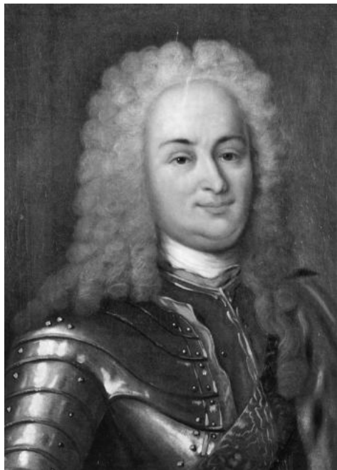
Князь Аникита Иванович Репнин

Современником и соратником Репнина был фельдмаршал князь Михаил Михайлович Голицын. Голицыну принадлежало сразу несколько крупных сел в Суздальском и Шуйском уездах, в том числе такие крупные как Лежнево (про него историк XVIII века писал «видится