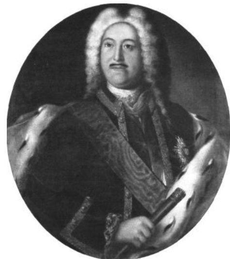
Князь Михаил Михайлович Голицын