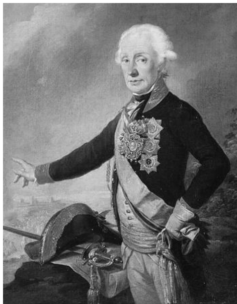
Граф Александр Васильевич Суворов

С Владимирским краем связаны биографии многих выдающихся полководцев России. А после того, как Пётр Великий ввел в армии высший военный чин генерал-фельдмаршала, примерно пятая часть всех обладателей этого звания оказалась непосредственно связана с Владимирской землей, в том числе и с Вязниковским краем. Наиболее известный из «наших» фельдмаршалов - Александр Васильевич Суворов. Он являлся помещиком Владимирской губернии, командовал Владимирской дивизией, несколько лет прожил в селе Ундола в пределах нынешнего Лакинска и даже выстроил церковь в одном из сел Суздальского уезда. Но Суворов был не первым фельдмаршалом на владимирищине.